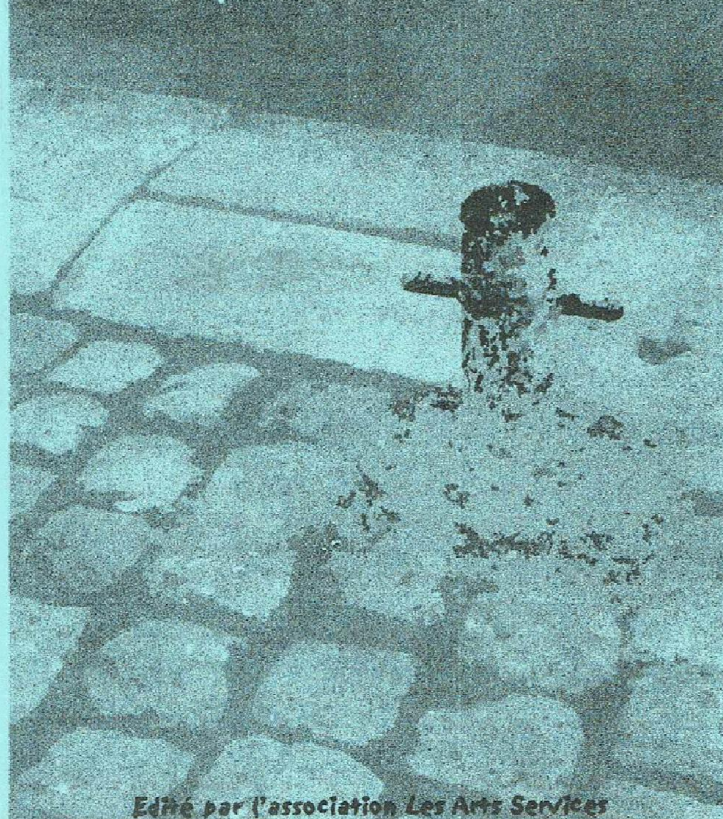
Edité par l'association Les Arts Services